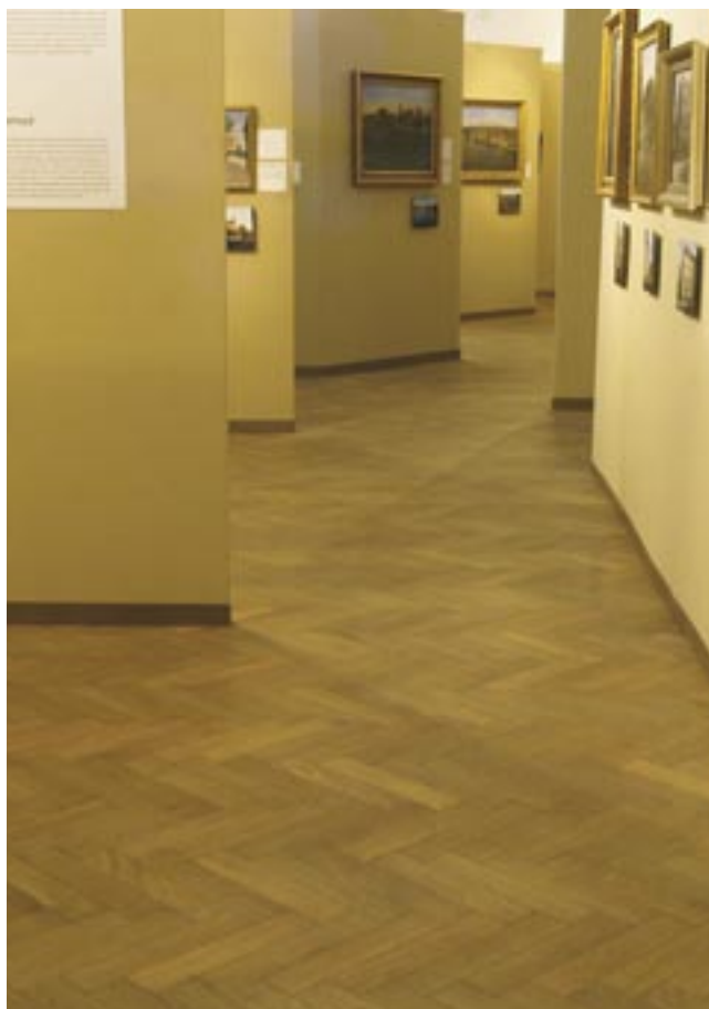
Ve výstavním sále se olejevaný povrch osvědčil