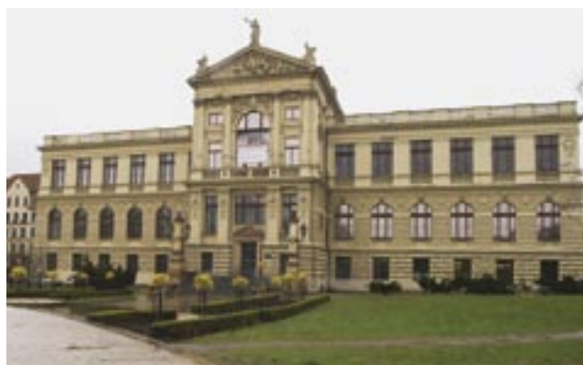
Muzeum hlavního města Prahy

Firma LERCH PODLAHY, s.r.o. pečuje o podlahy v muzeu už víc než deset let, od doby, kdy bylo potřeba obnovit parket v sále, který užívala taneční škola. Zde bylo nezbytné, vzhledem k poškození parkety kompletně vyměnit. V ostatních prostorách muzea jsou zachovány původní dubové parkety. Podle slov majitele realizační firmy pana M. Lercha jde o mimořádně kvalitní parkety, které byly vyráběny ručně z dřeva starých dubů a také jejich pokládka je velice precizní. Proto byly ve výstavních sálech i sálech expozic pečlivě rekonstruovány a povrchově upravovány lakem. Lak má však v těchto mimořádně zatěžovaných prostorech nevýhodu – lze ho poškrábat, například při manipulaci s výstavními panely, vryp zčerná a oprava není zrovna jednoduchá. Proto pan Lerch doporučil muzeu vyzkoušet jinou povrchovou úpravu – napuštění parket olejem.