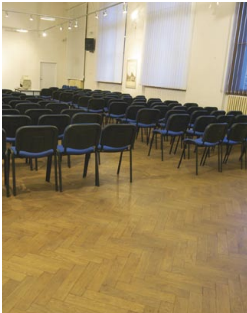
Také přednáškový sál má své původní parkety ošetřeny olejem